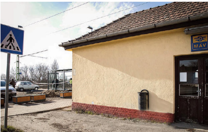
Tavaly februári felvételünkön még épült az erdőkertesi fedett vasúti megálló, vagyis az utasbeálló

Sülysápon felújították a felvételi épületet, az aluljárót és a peronokat, valamint kiépült a vagyonvédelmi rendszer is. Alsógalla, Felsőpakony, Ferihegy, Rákoskert, Rákospalota-Kertváros, Vác-Alsöváros, Vecsés-Kertekalja és Vicziántelep megállóhelyeken a peronokon új padokat és hulladékgyűjtőket helyeztek ki, valamint új biztonságtechnikai rendszert építettek ki, továbbá Alsógallán, Rákospalota-Kertvárosban és Vicziántelepen is végeztek felújításokat.