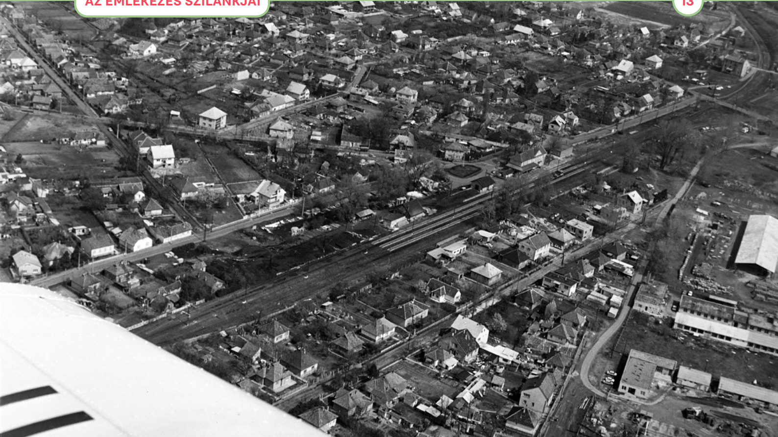
Légifelvétel Veresegyházról 1983-ból